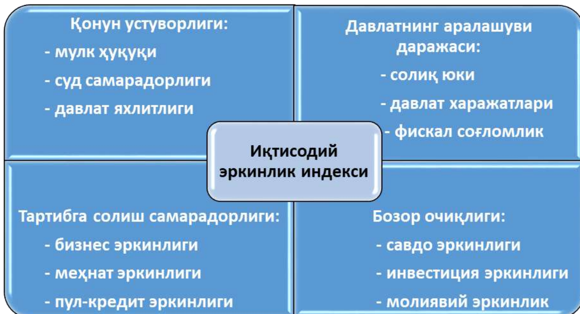
1-расм. Иқтисодий эркинлик индексининг 4 тоифа бўйича 12 та иқтисодий эркинлик кўрсаткичлари 7

Мамлакатлар иқтисодий ислоҳотларни белгилашда ва амалга оширишда индексдаги энг паст балл тўплаган эркинлик омилларига доир натижаларни яхшилашга қаратилган мақсадли вазифаларни қўйиши, уларнинг иқтисодий кўрсаткичларини яхшиланишига самарали имконият яратиши мумкин.