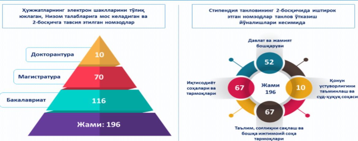
5-расм. Жамғарманинг 350 ўринга мўлжалланган навбатдаги стипендия танлови 1-босқичидан ўтган номзодлар тўғрисида маълумот.

Техник гуруҳ томонидан Низом талабларига жавоб берадиган биринчи босқичида зарур ҳужжатларни электрон шаклда платформага юклаган жами 196 нафар номзодлар иккинчи босқичга тавсия этилган.