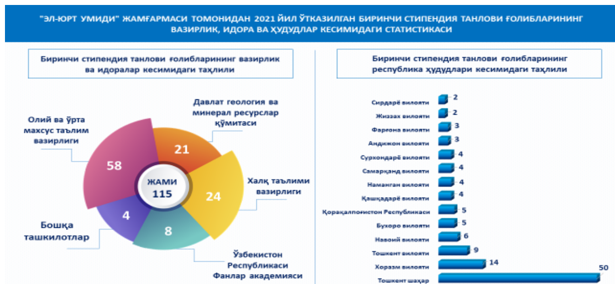
2-расм. Жамғарманинг 2021 йилдаги биринчи стипендия танлови ғолибларининг вазирлик ва идоралар ҳамда вилоятлар кесимида маълумот.

Биринчи стипендия танлови ғолибларини фанлар кесимида таҳлили қиладиган бўлсак, кимёдан 38 нафар , геологиядан 33 нафар , математикадан 24 нафар , биологиядан 20 нафар иқтидорли ёшлар ва соҳа мутахассислари саралаб олинган.