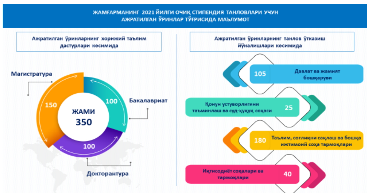
3-расм. Жамғарманинг 350 ўринга мўлжалланган навбатдаги стипендия танловининг таълим дастурлари йўналишлар тўғрисида маълумот.

Ўзбекистон Республикаси Президенти Мурожаатномасида ҳамда юқоридаги Фармонда “Эл-юрт умиди” жамғармасига берилган топшириқлар ижросини таъминлаш мақсадида барча таълим йўналишлари ва мутахассисликлар бўйича Жамғарманинг 350 ўринга мўлжалланган навбатдаги стипендия танловлари жорий йил апрел-май ойларида ўтказилди.