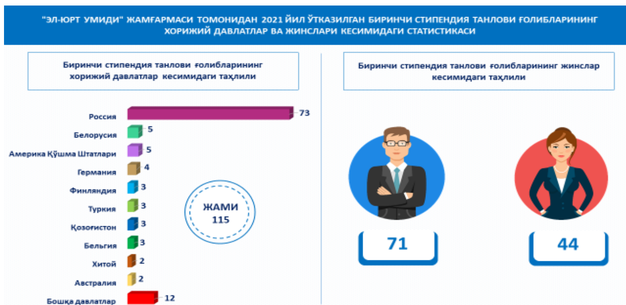
6-расм. Жамғарманинг 2021 йилдаги биринчи стипендия танлови ғолибларининг хорижий давлатлар ва жинслар кесимидаги статистикаси.

Жамғарманинг математика, кимё, биология ва геология фанлари бўйича 2021 йил январь-март ойларида ўтказилган 1-стипендия танлов натижаларига кўра ғолиб бўлган жами 115 нафар стипендиатлар орасидан 44 нафари ёки 38% хотин-қизларни ташкил этади.