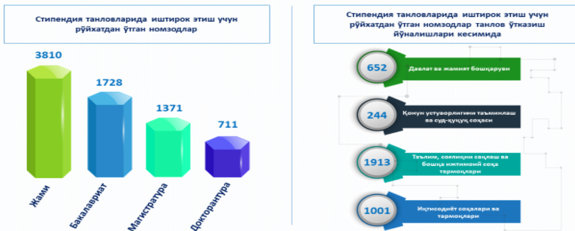
4-расм. Жамғарманинг 350 ўринга мўлжалланган навбатдаги стипендия танловида қатнашиш учун рўйхатдан ўтган номзодлар тўғрисида маълумот.

Мазкур танловда иштирок этиш истагида бўлган номзодлар Жамғарма расмий веб сайтида онлайн ҳужжат топшириш платформаси орқали бакалаврият таълим дастури дастури бўйича 1728 нафар , магистратура таълим дастури бўйича 1371 нафар ва докторантура таълим дастури бўйича 711 нафар , жами 3810 нафар , номзодлар танловда қатнашиш учун рўйхатдан ўтишган.