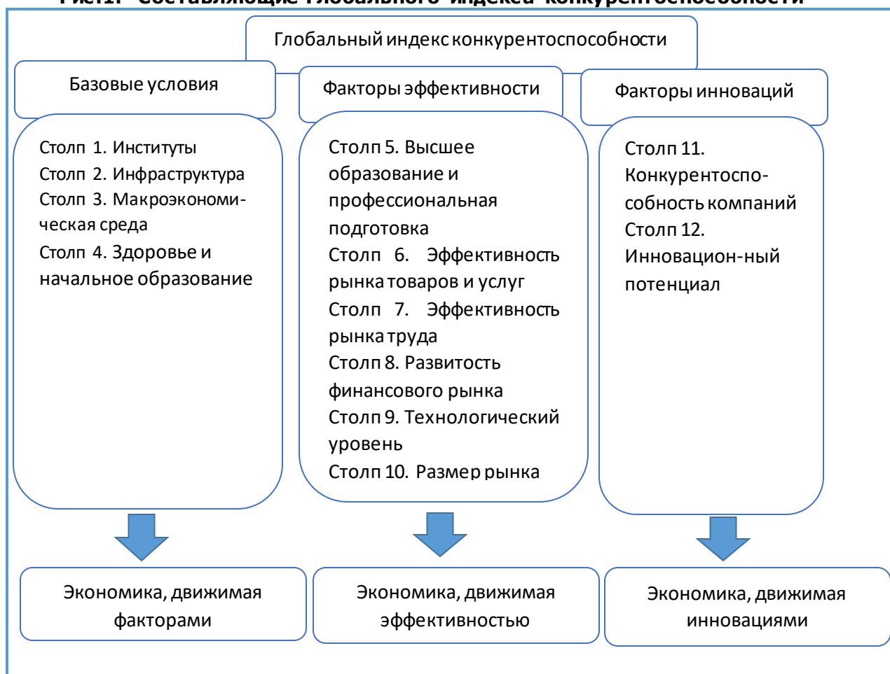
Рис.1. Составляющие Глобального индекса конкурентоспособности