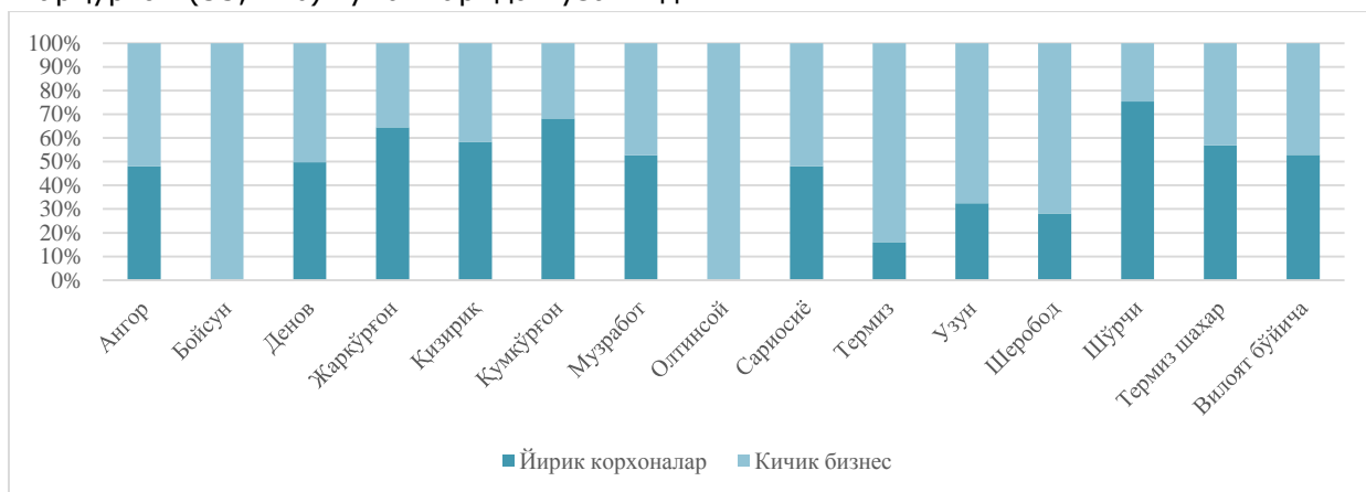
3-расм. 2018 йилда Сурхондарё вилояти туман (шаҳар)лари бўйича кичик бизнеснинг саноат маҳсулотлари ишлаб чиқаришдаги улуши (% да) 5 .

Ҳудудлар кесимида кичик бизнеснинг саноат маҳсулотлари ишлаб чиқаришдаги энг юқори улуши Олтинсой (жами саноат маҳсулотлари ишлаб чиқаришдаги улуши 100,0 %), Бойсун (99,9 %), Термиз (83,9 %), ва Шеробод (71,9 %) туманларида кузатилди. Шу билан бирга, энг кичкина улуш Шўрчи (24,5 %), Қумқўрғон (31,8 %), Жарқўрғон (35,4 %) туманларида кузатилди.